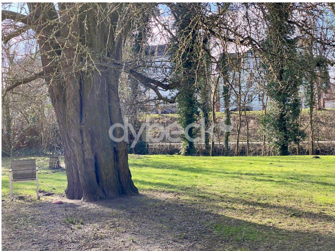
Garten zur Ilmenau