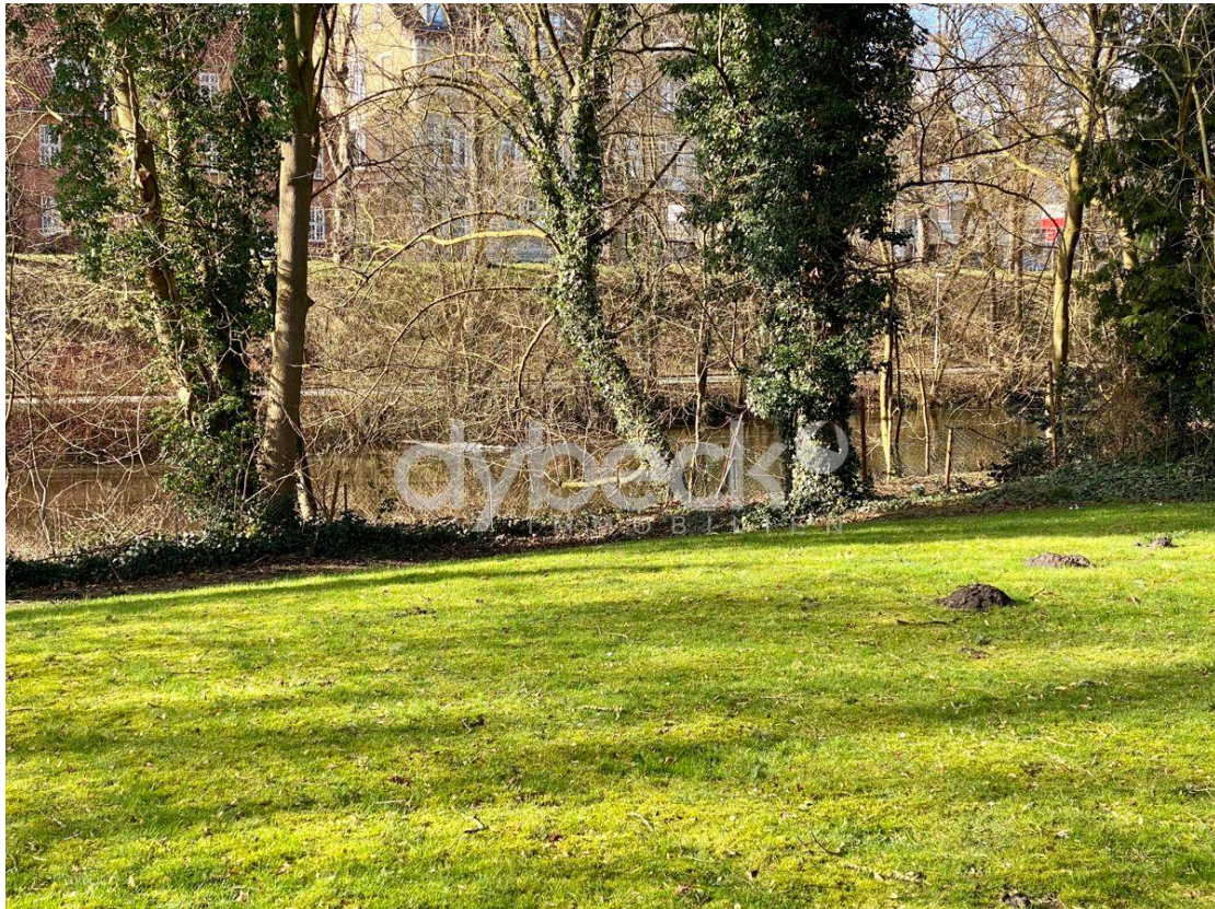
Garten zur Ilmenau