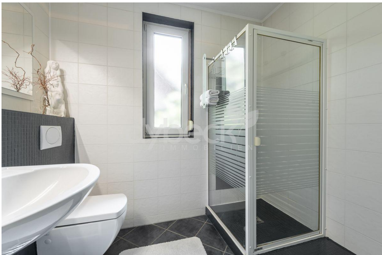
Bad im Erdgeschoss