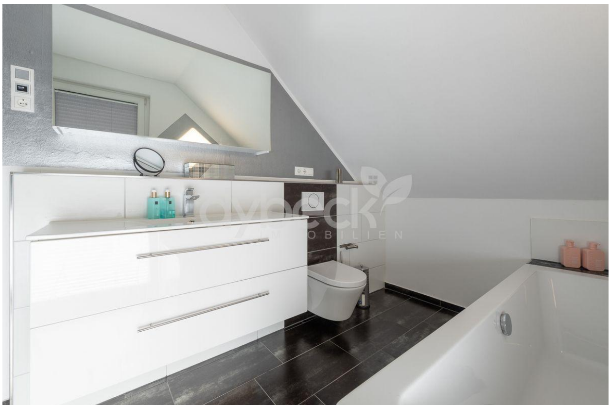
Bad im Obergeschoss