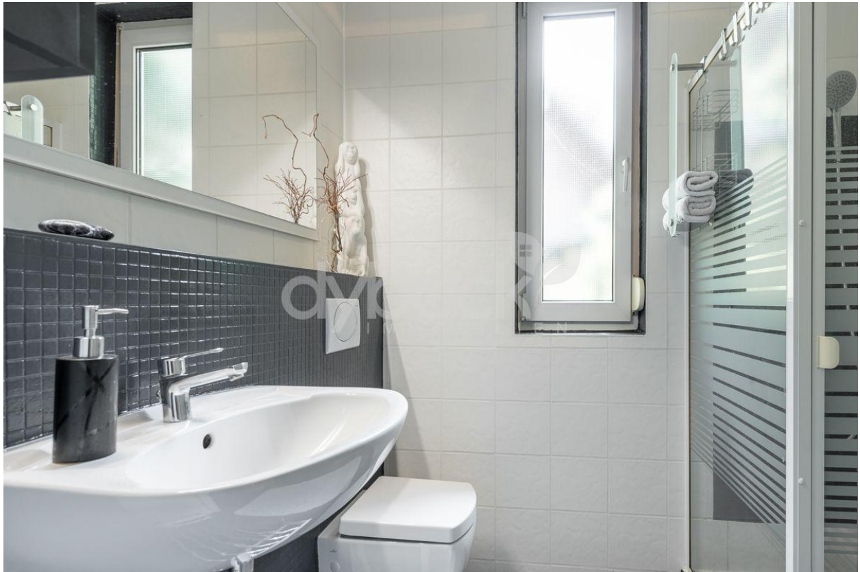
Bad im Erdgeschoss