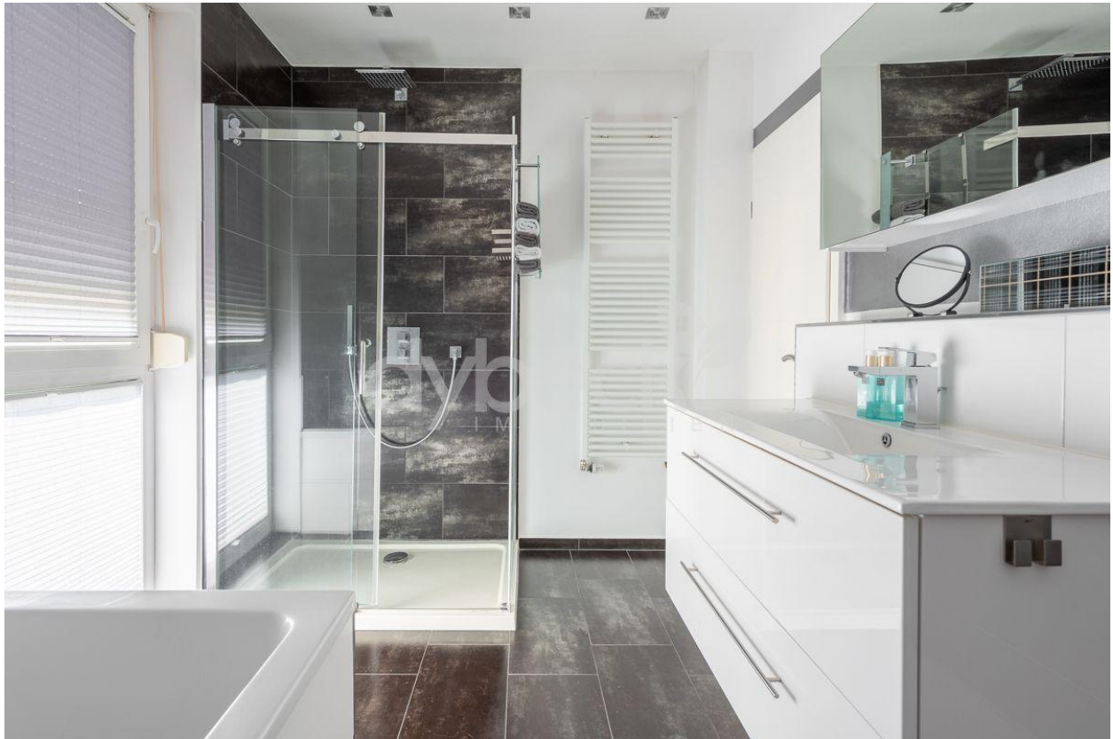
Bad im Obergeschoss