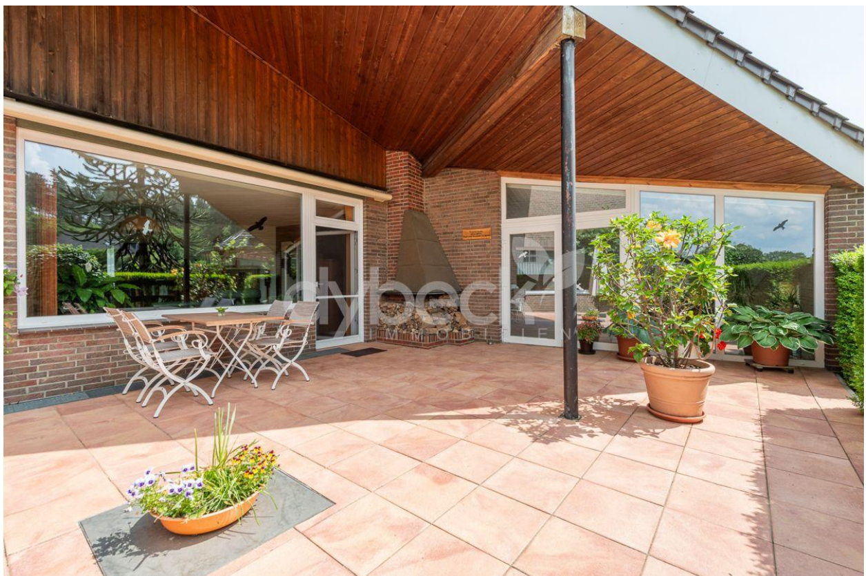
Überdachte Terrasse mit Kamin