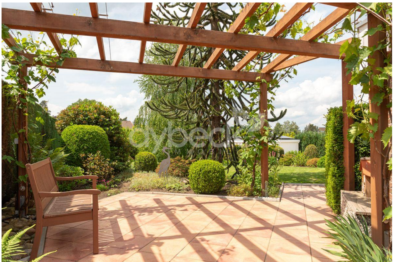
Terrasse mit Pergola