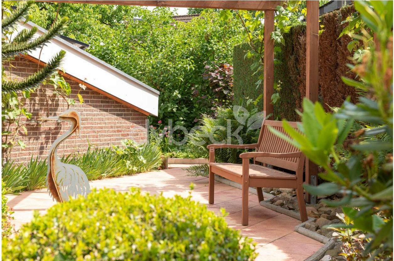
Platz zum Verweilen