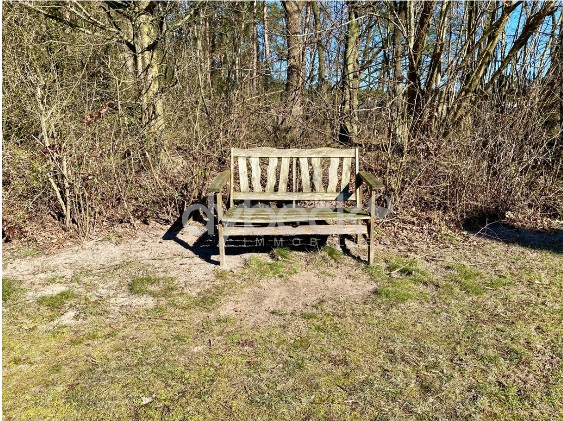
Entspannen im Grünen