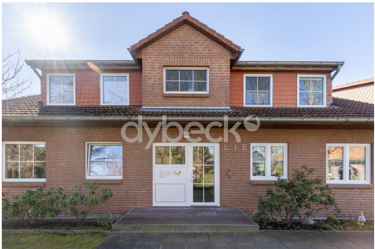
Kapitalanlage in gefragter Lage