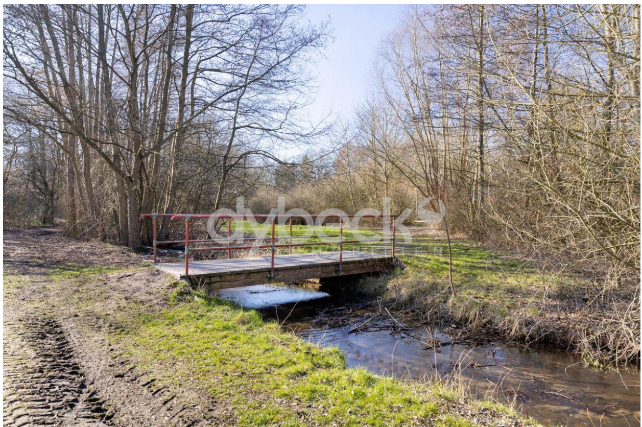
Teichau in Adendorf