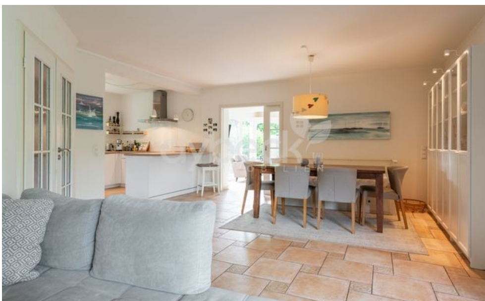
Wohnen und Essen