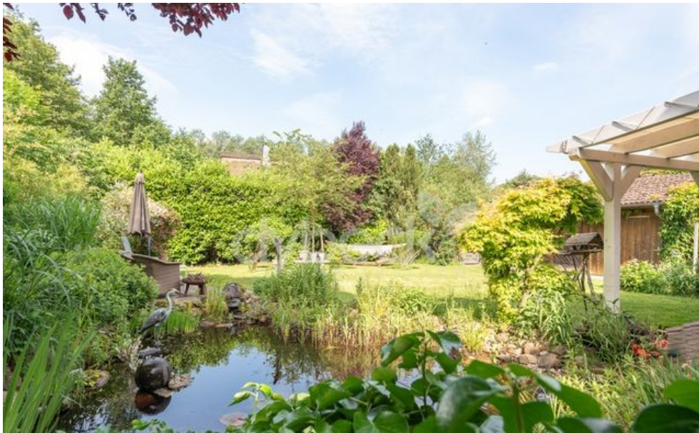
Blick ins Grüne