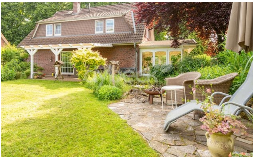
Platz zum Verweilen