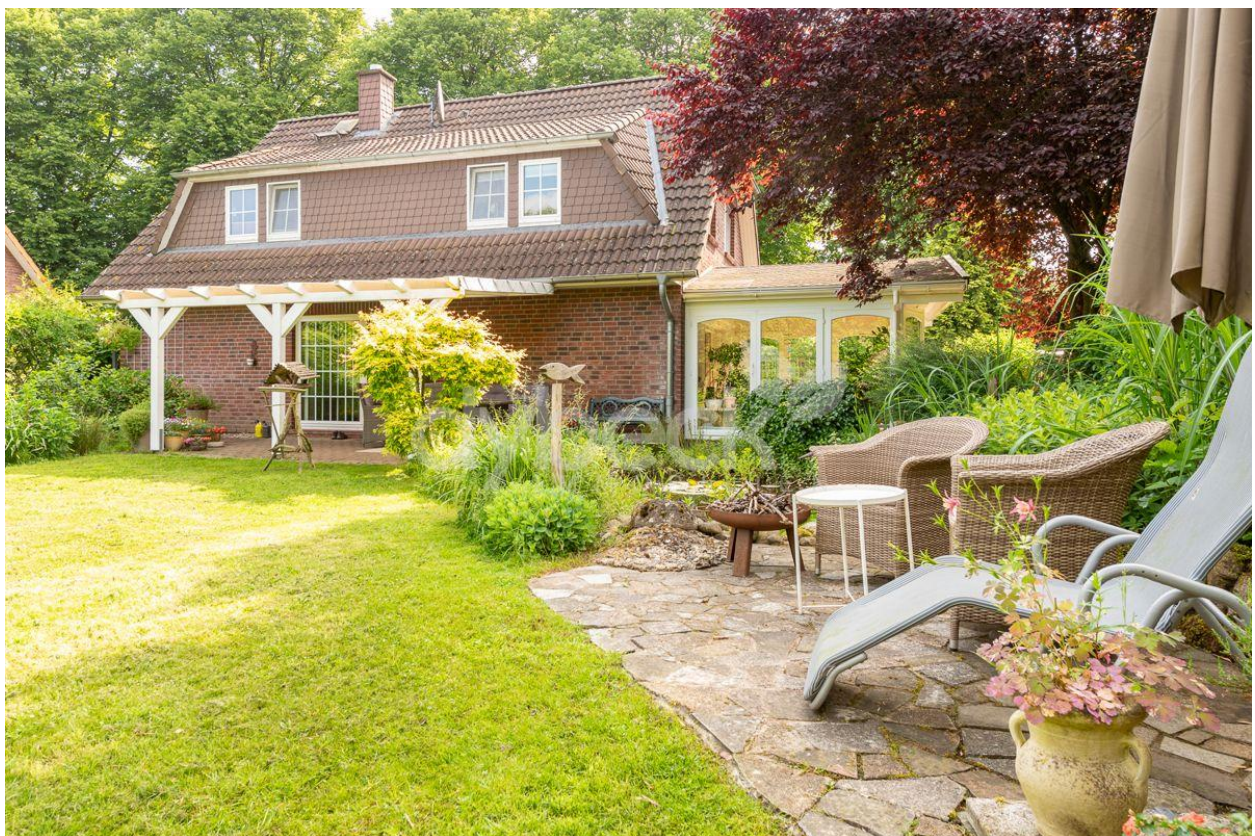
Platz zum Verweilen