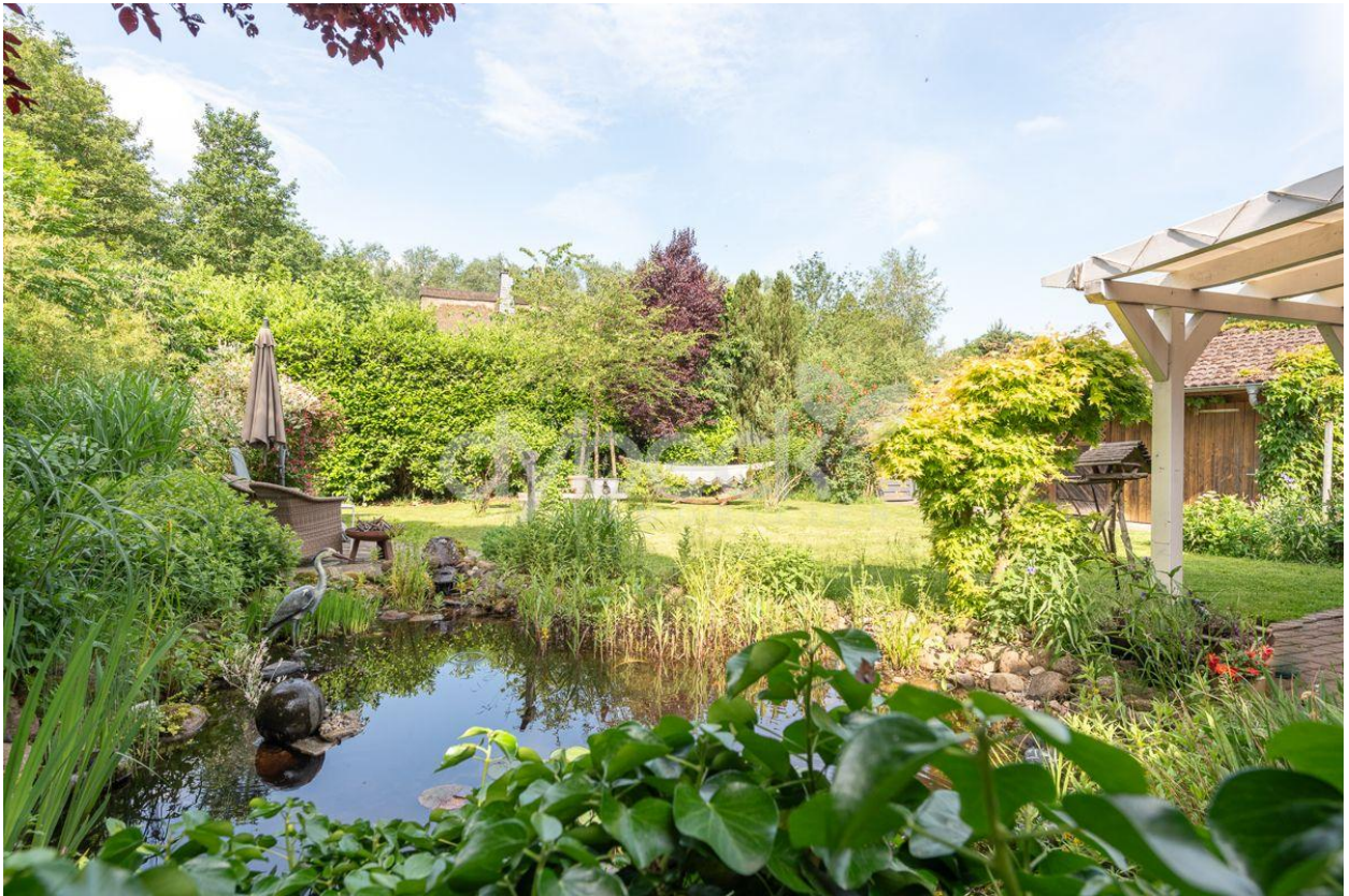
Blick ins Grüne