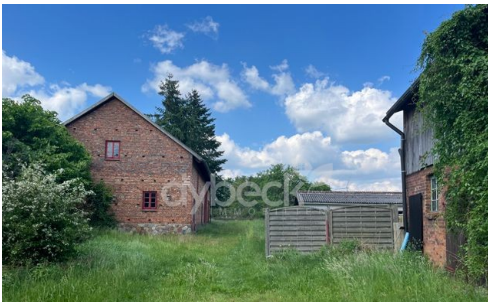
Grundstück mit Nebengebäude