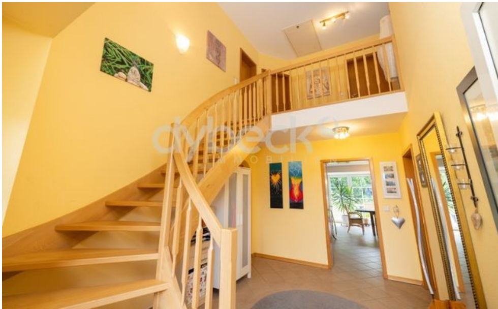
Treppe und Galerie