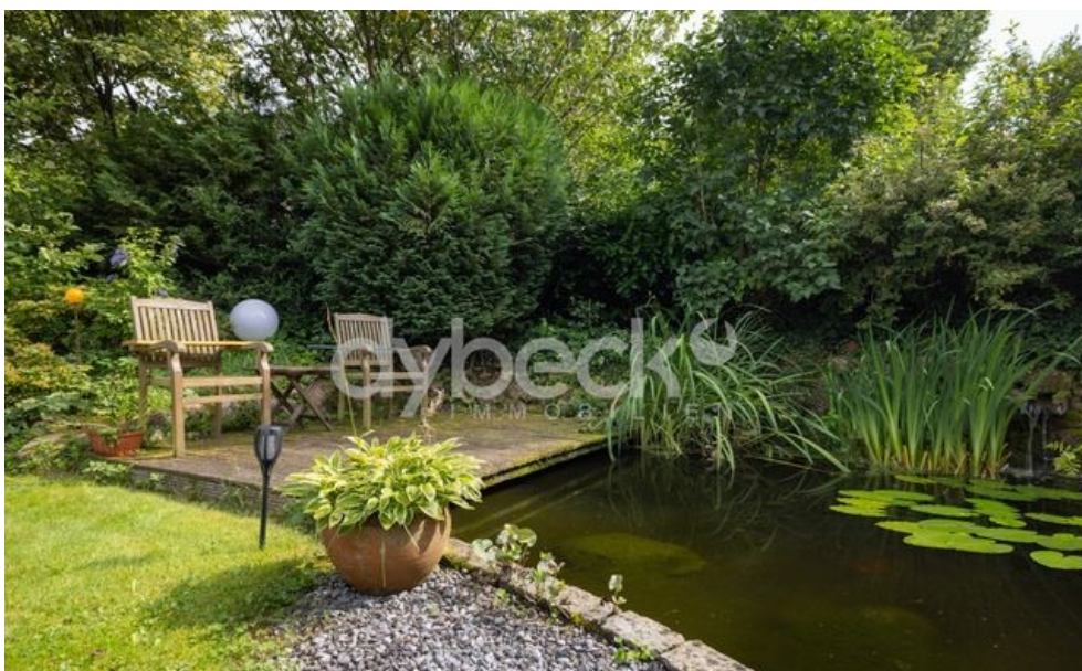
Ihr Platz am Teich