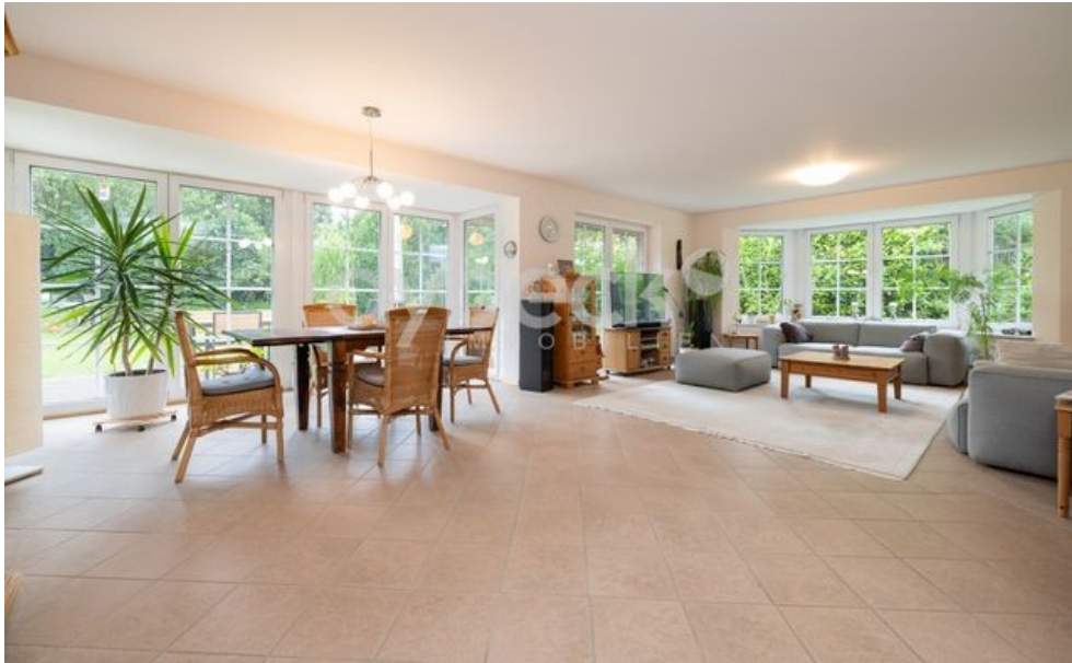
Ess- und Wohnzimmer