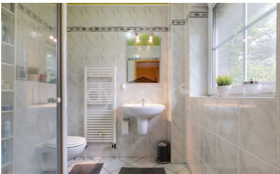
Bad en Suite