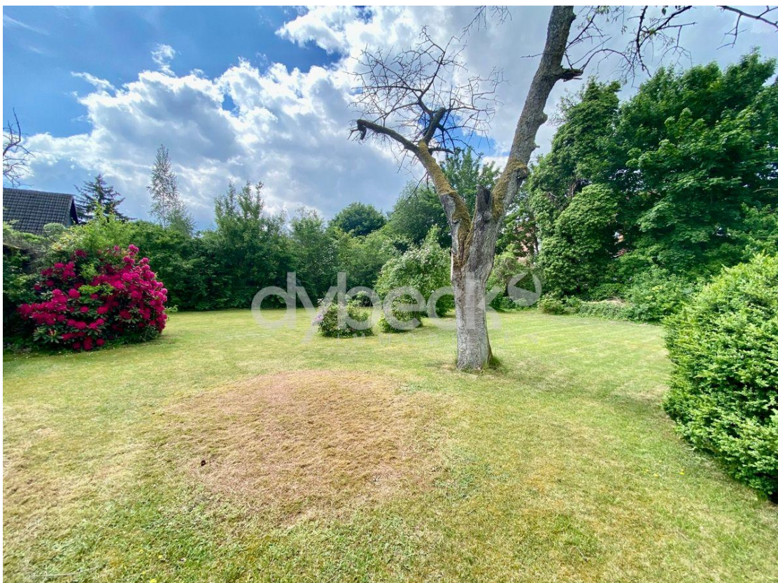
Viel Platz für Ihr Projekt