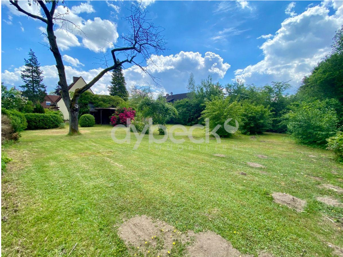
Enormes Potenzial in bester Lage